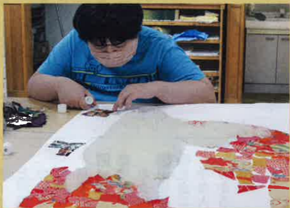
地道な作業は続きます。コツコツと布を貼っています。