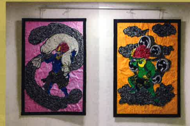
風神雷神／古新聞や加古川の地場産業靴下の切れ端を再利用