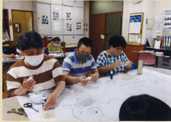
毛糸を丸めています。