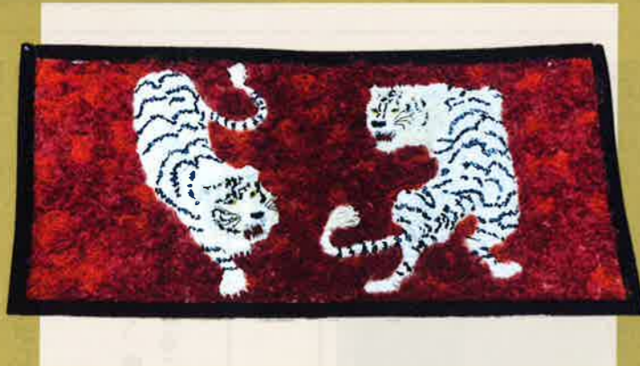
ホワイトタイガー／牛乳パックを再利用