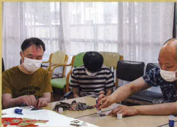
丸めた素材に糊付けしています。