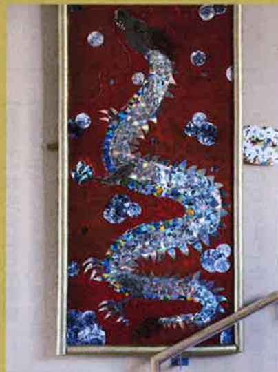
昇り龍／聴けなくなったCDを再利用