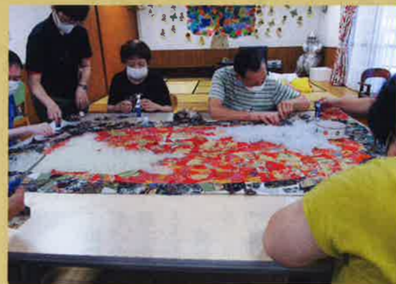
間もなく完成だ!! 最後まで頑張るぞー!!