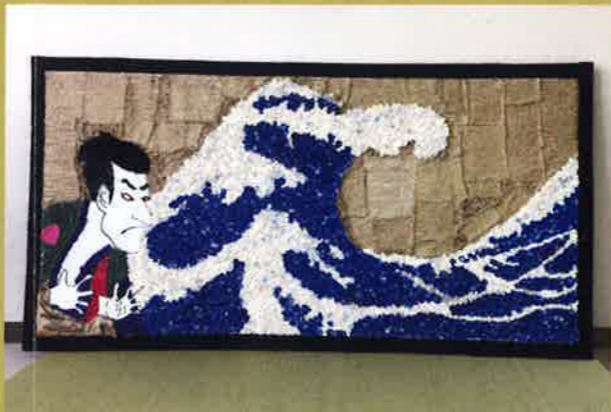
浮世絵／トイレトペーパーの芯を再利用